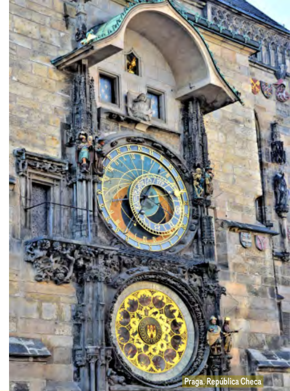
Praga. República Checa