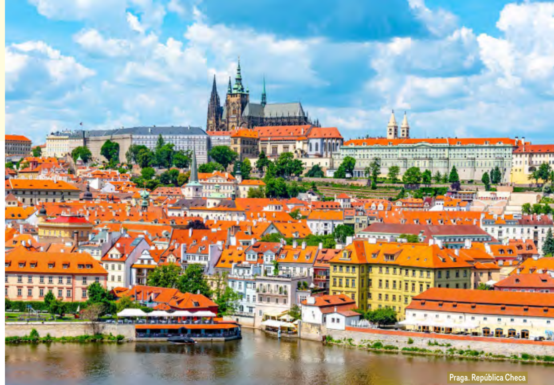
Praga. República Checa