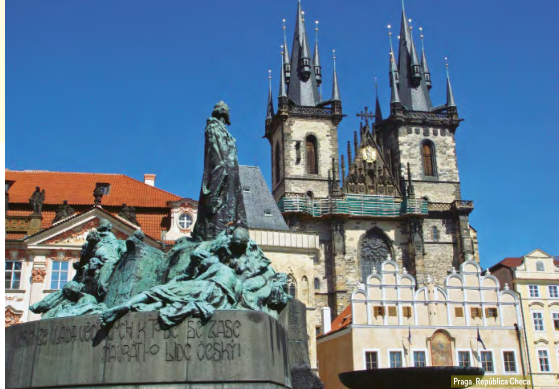
Praga, República Checa